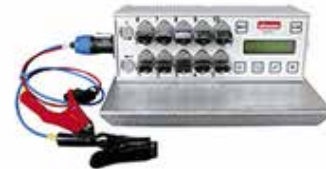
Steuerggerät 12 V