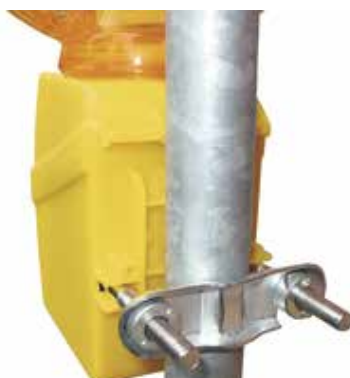
Monolight mit Masthalter