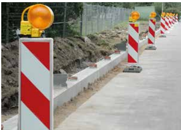
BakoLight auf Leitbake