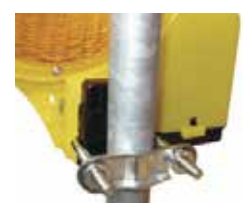
BakoLight mit Masthalter