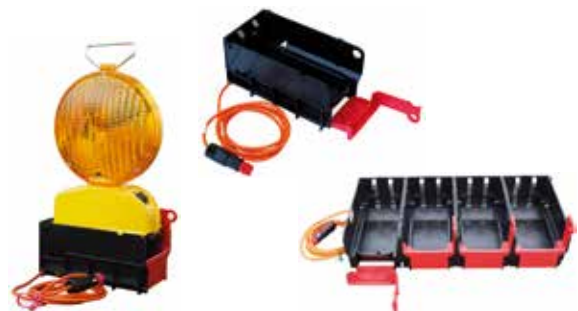
1- und 4-fach Transport- und Ladeschale